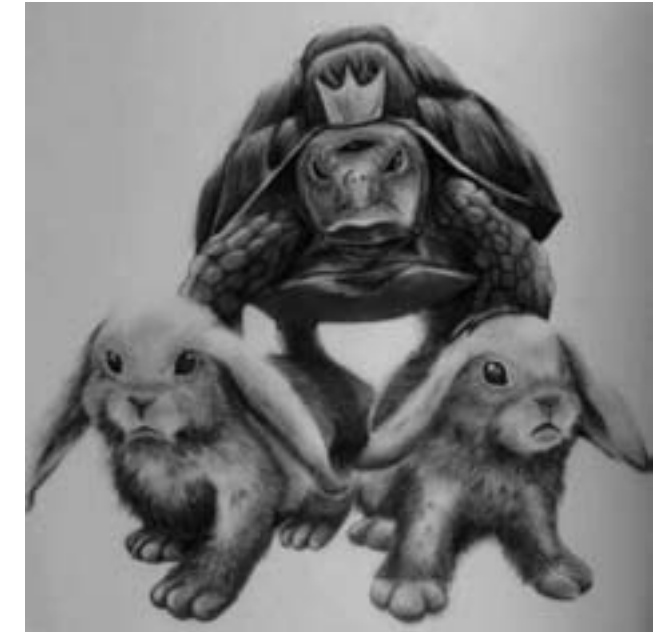
Satrio Hari Wicaksono. "Hegemony". 2013. Charcoal on Paper

Pameran ini akan mengedepankan pencapaian individu setiap dosen; seberapa ‘penting’ pencapaian kreativitas dan pemikiran mereka, terkait dengan eksistensinya sebagai ‘sosok’ pengajar. Dari pameran ini juga akan dilihat, apakah kini, di tengah latar belakang sosial, politik, ekonomi, dan budaya