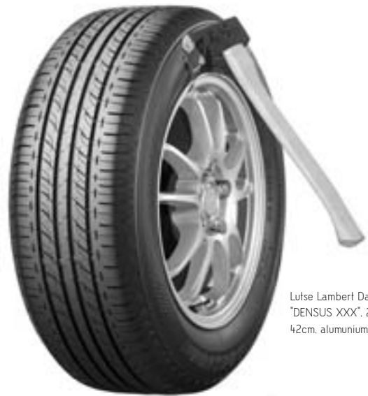
Lutse Lambert Daniel Morin. "DENSUS XXX", 2013. 60 x 60 x 42cm. aluminium (on progress)