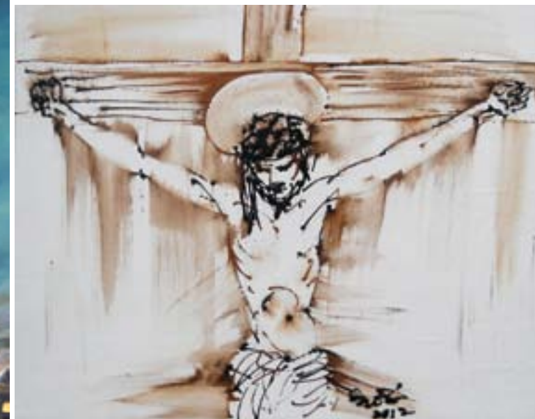
Subroto Sm. "Penyaliban". 2012. 70 x 90 cm. cat akrilik di kanvas