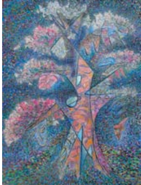
Titoes Libert. "Khat", 2013. 90 x 120 cm. mix media