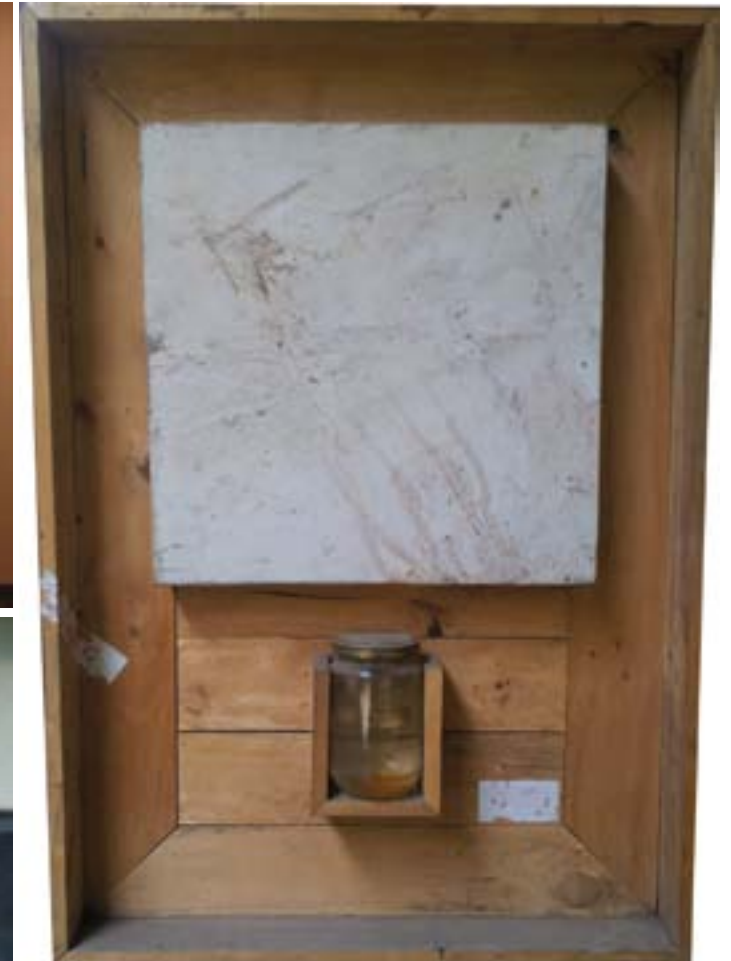
Tisna Sanjaya. "Seri Air Kehidupan". 50 x 40 cm. mix media