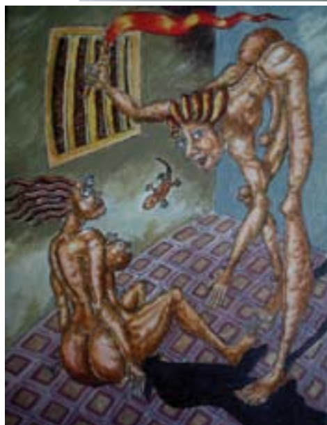
Pracojo. "The Power Culture". 2013. 45 cm x 55 cm. akrilik pada kanvas