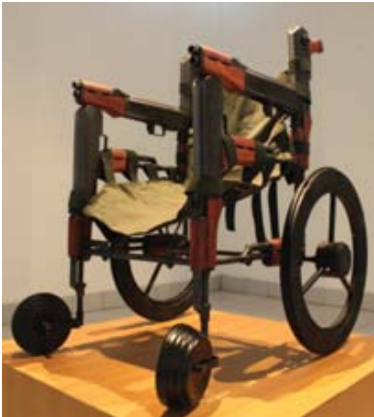
Setyo Priyo Nugroho. "Go Home". 2012. 80 x 80 x 120 cm. Senapan mainan plastik, besi dan kayu jati

#5: "Eat that over which the name of Allah has been mentioned, if you are believers in His revelations."