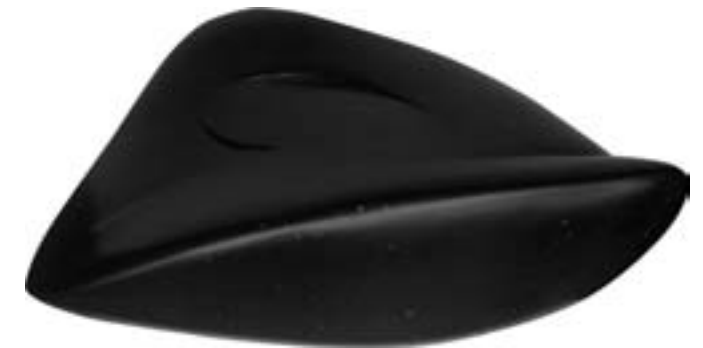
Dendi Suwandi. "Lafaz dalam Tiga Matra". 2013. 38 X 48 X 15 cm. Satam Stone.