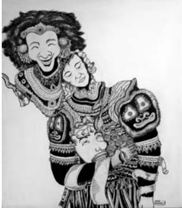
Wiwik Sw., "Behind the Mask". 2013. 80 x 70 cm. Ink on Canvas

yang terus bergeser, karya-karya para dosen dari kedua institusi ini masih menunjukkan perbedaan, atau kesamaan? Dari fakta-fakta hari ini, lantas apakah yang bisa diperbincangkan, dan lebih jauh lagi apa yang bisa diagendakan oleh kedua institusi penting ini?