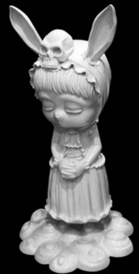
AC Andre Tanama, "After Beuys", 2013, 85 x 85 x 125 cm, painted fiberglass