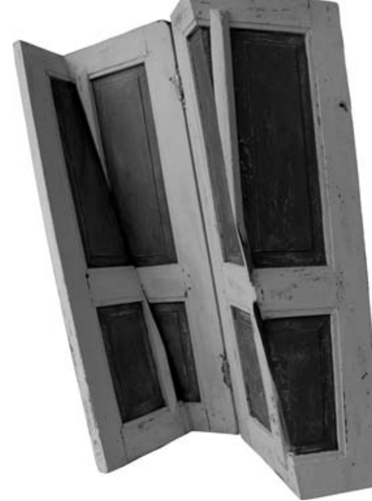
Anusapati, “Seri Lipatan (Fold Series) #1”, 2013, k.l 80 x 80 x 20 cm, Kayu Jati

Dalam kasus pameran-pameran seni kontemporer Indonesia yang menjadi bahan kajian saya – dalam kondisi arus kuat pasar seni lukis –,