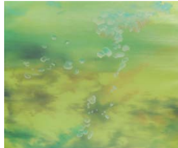
Dikdik Sayahdikumullah. "Greencoloring", 2013. 50 x 60 cm. oil on canvas