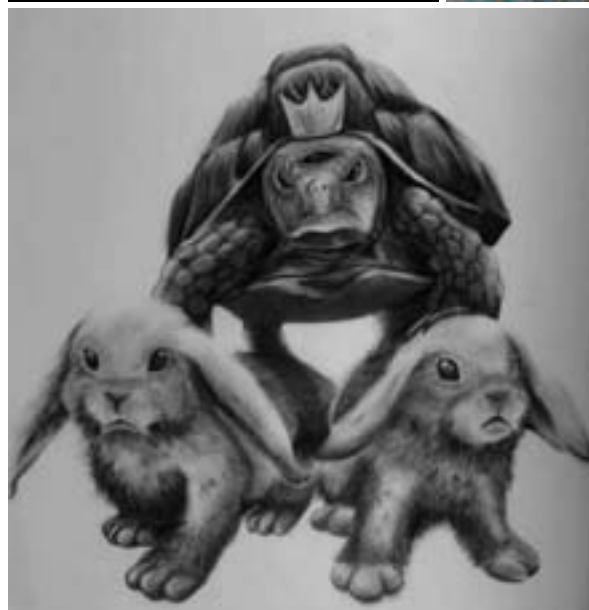
Satrio Hari Wicaksono. "Hegemony". 2013. Charcoal on Paper