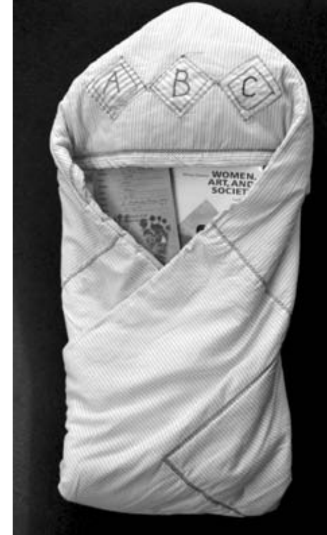
Ira Adriati W. "In Between Motherhood and Self Actualization", 2013. Video Art, durasi 5 menit

Hemat saya dalam kondisi terakhir ini dimana boom pasar seni rupa kontemporer terkoreksi akibat resesi ekonomi, tidak perlu menjadi constrain utama. Sudah banyak indikasi diperlukannya fase baru perkembangan pranata seni rupa Indonesia yang lebih terstruktur, kajian dan karya seni yang memperkaya spektrum seni, yang dalam hal ini bisa diperankan oleh Perguruan Tinggi.